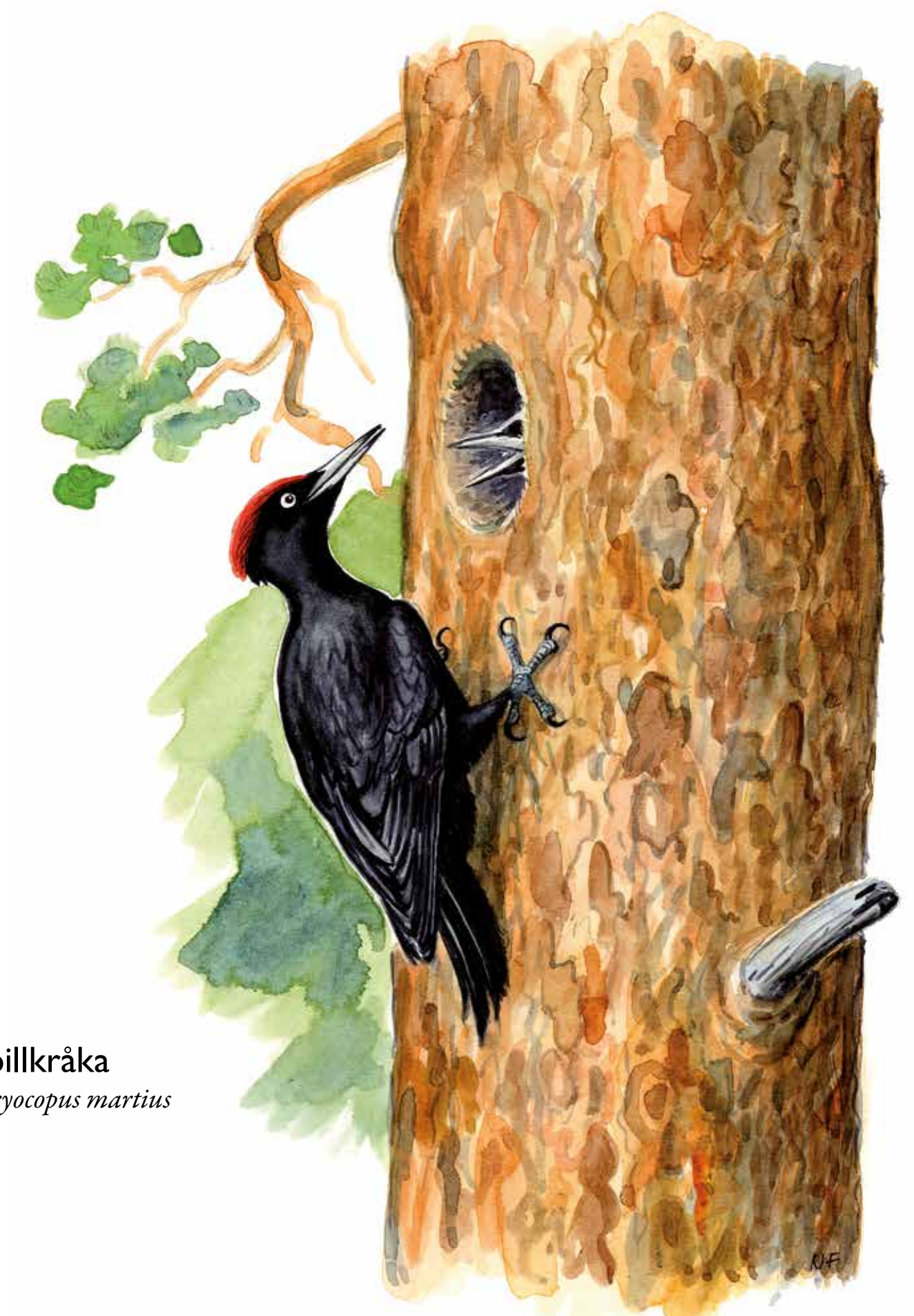
Spillkråka Dryocopus martius

Here at Gärdesudden, a small piece of countryside has been preserved for the future. A green oasis, where no roads or houses can be built. A place for people to relax and explore. But also a haven for rare animals and plants. Here you find pine forest, leafy woods and open meadows. Several rare species of fungi, lichens and insects are associated with the old pines. The deciduous wood and open meadows also harbour a rich flora and fauna. Several paths go through the reserve. Some lead out to the tip of the promontory and offer fine views across the fairway leading to Stockholm and the giant ferries that go past.