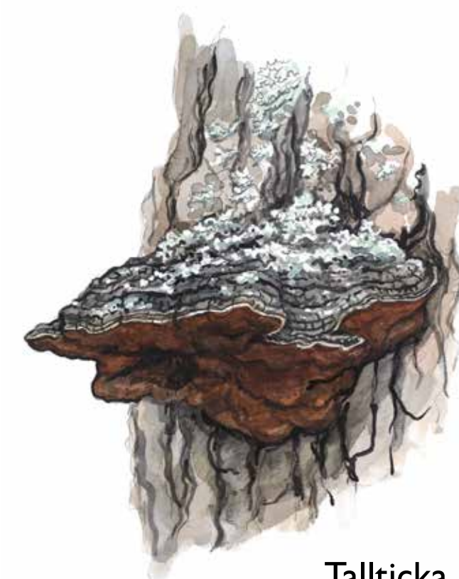
Tallticka Phellinus pini

Talltickan har en nyckeroll i äldre tallskogar. Den rötter veden och gör den mjuk. Spillkråkan hackar gärna ut sitt bohål nära svampangreppet. Så småningom blir stammen där svampen sitter så svag att den går av. En tallhögstubbe har skapats, där slagugglan och andra ugglor kan bygga bo.