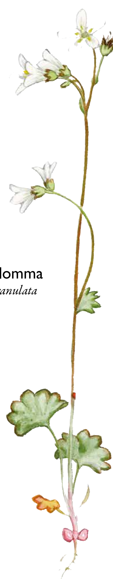
Mandelblomma Saxifraga granulata

På en strandnära håll innanför båtbyggarna växer örter som jungfrulin, mandelblomma och vit fetknopp.