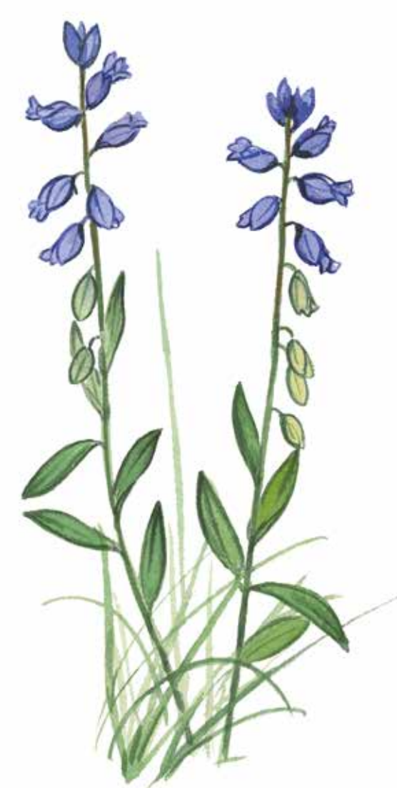
Jungfrulin Polygala vulgaris

Talltickan har en nyckeroll i äldre tallskogar. Den rötter veden och gör den mjuk. Spillkråkan hackar gärna ut sitt bohål nära svampangreppet. Så småningom blir stammen där svampen sitter så svag att den går av. En tallhögstubbe har skapats, där slagugglan och andra ugglor kan bygga bo.