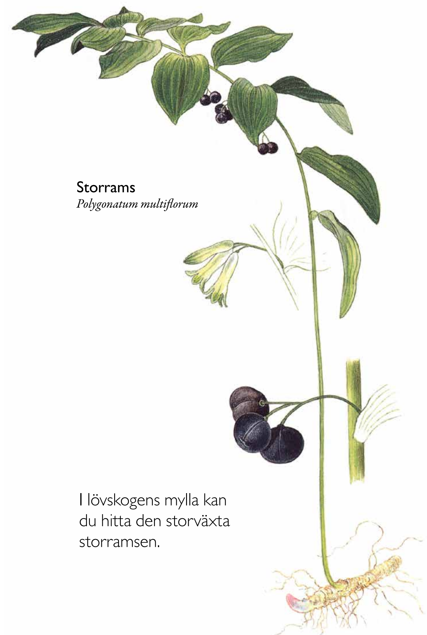
Storrams Polygonatum multiflorum

På en strandnära håll innanför båtbyggarna växer örter som jungfrulin, mandelblomma och vit fetknopp.