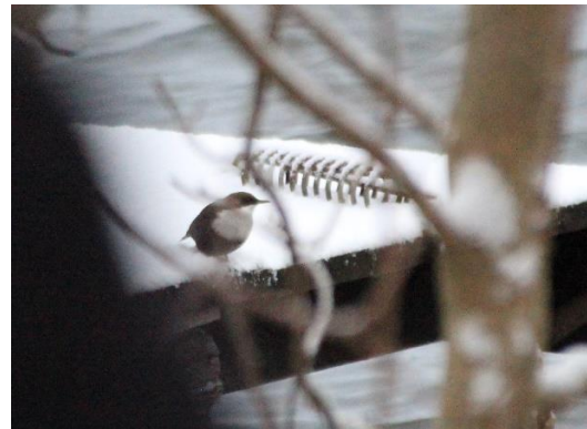
Bild 4. Strömstaren är dock inte den som är den, och snart därefter lät den sig beskådas av samtliga närvarande. Strömstaren sittande på bryggan vid Lövbergaviken.