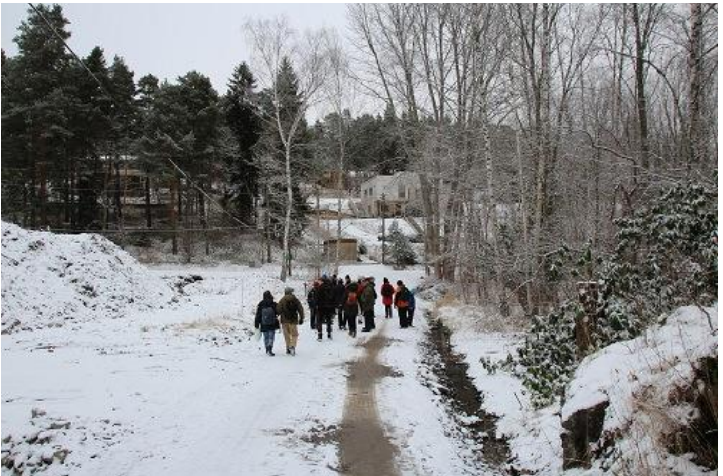
Bild 7. På Spångvägen. På väg mot Ättiksfabriken passerade vi Wiboms trädgård till höger. Fastigheten till vänster i bild är ännu obebyggd.