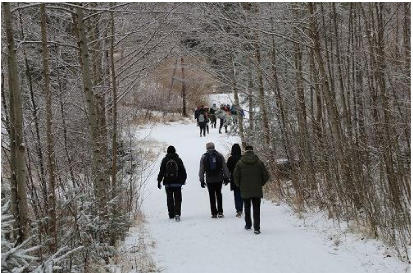
Bild 5. Vandringen fortsatte sedan vidare mot spången vid Näckdjupet, där vi blev informerade om de arbeten som utförts i Sågsjöbäcken till gagn för öringens vandring till och från Sågsjön.