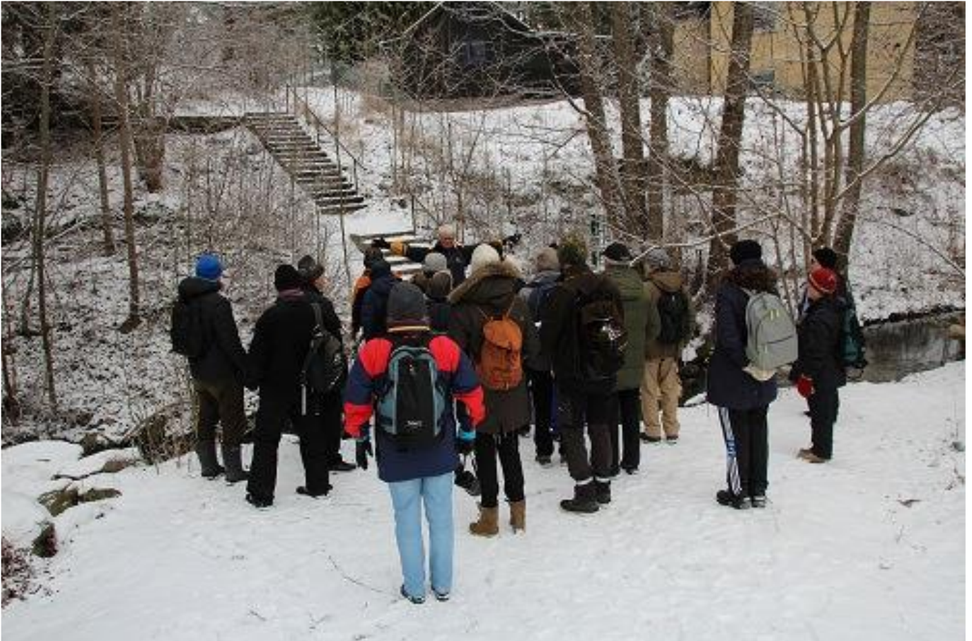
Bild 6. Framme vid spången vid Näckdjupet. På bilden ses B-O illustrera hur stora fiskar som setts i bäcken.