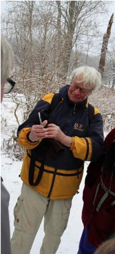
Bild 3. B-O som är en van ledare lät sig inte nedslås av detta utan ordnade snabbt med teknikens hjälp så att vi åtminstone till lätet fick uppleva strömstaren.