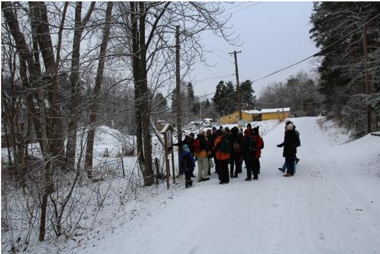
Bild 8. Vid Solviksvägen. Gruppen samlad vid informationstavlan tillhörande Wiboms trädgård.

Allt som allt syntes strömstaren vid tre tillfällen under vandringen, förutom strömstare fick vi även sällskap av de vanliga vinterfåglarna som talgoxe, koltrast, grönfink med flera. Vandringen var angenäm och alla närvarande fick chansen att se strömstaren.