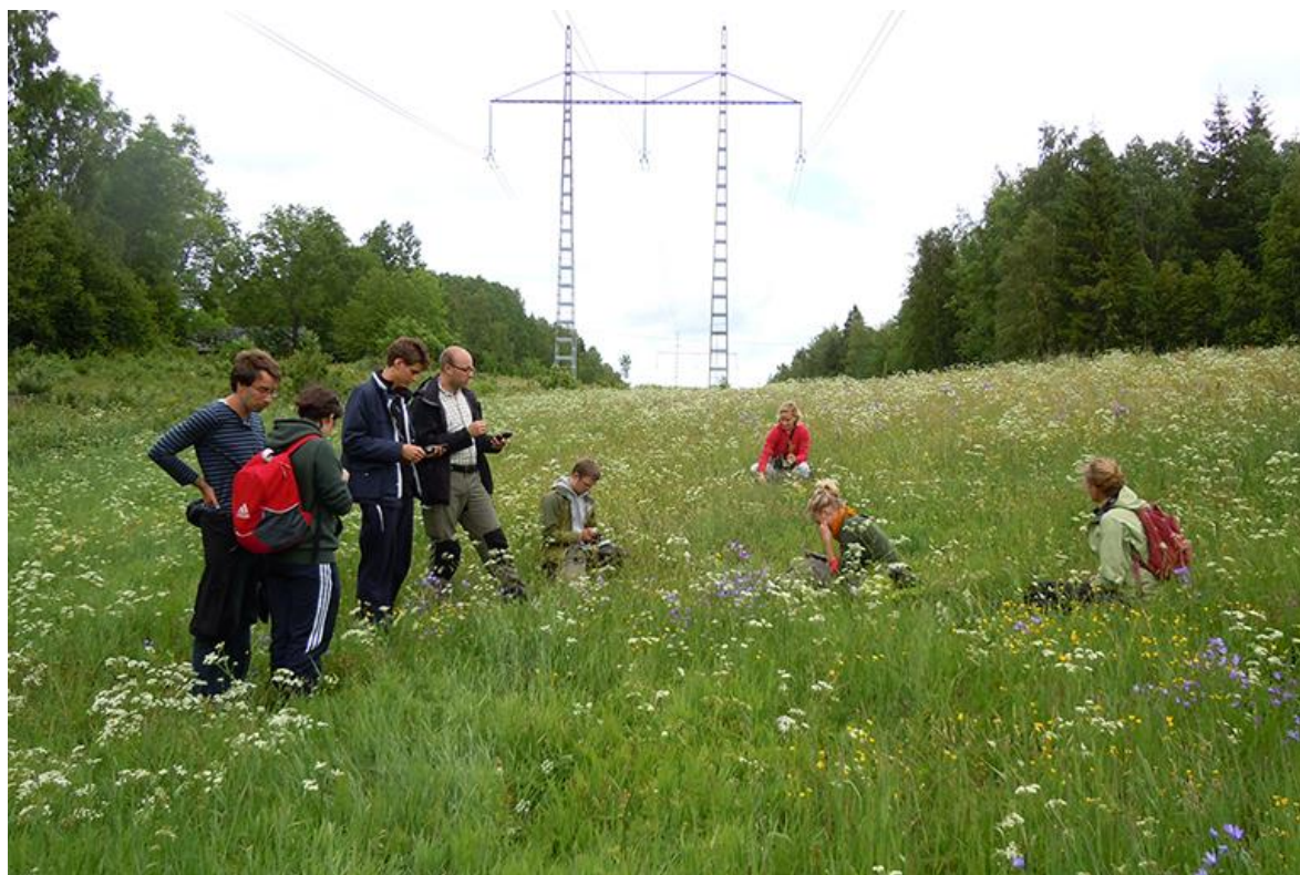
Fotografiet är taget under en inventering av ledningsgatans växt- och djurarter.

Kraftledningsgatorna har genom studier i biologisk mångfald visat sig kunna vara livsmiljö för flera hotade växt- och djurarter, fjärilar och andra insekter. Genom den kontinuerliga röjningen hålls marken öppen eller halvöppen för blommande örter och buskar, vilket lockar insekterna. I urban miljö där ängs- eller betesmarker är en bristmiljö blir kraftledningsgatorna extra betydelsefulla. Om röjningarna upphör förändras biotopen, vilket kan bli intressant att följa. Här efterlyser vi en diskussion kring möjligheterna sedan ledningarna markförlagts.