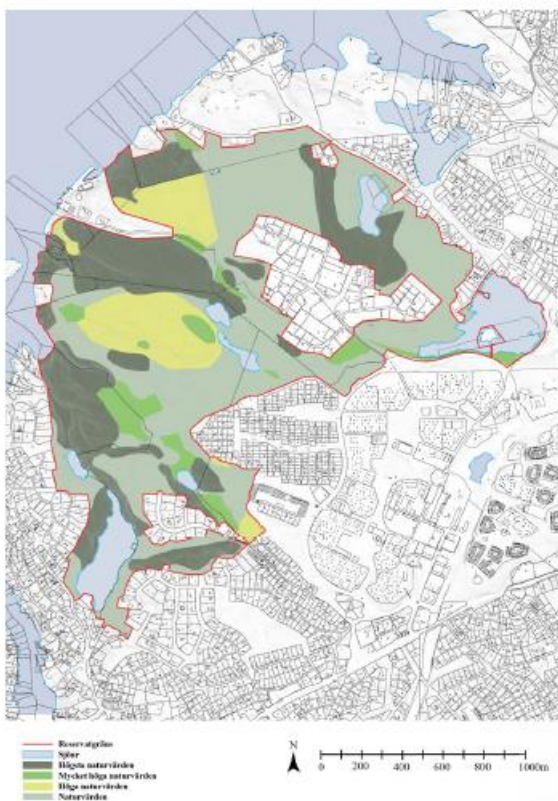
Karta 1. Förslag till antagandebeslut Naturreservat Skarpnäs daterat augusti 2015.