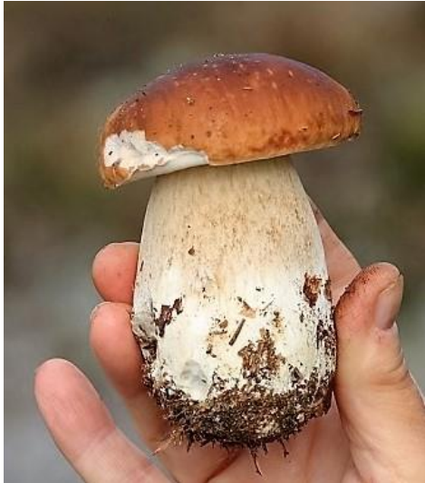
En fin Karljohan.

Karljohan, Smörsopp, Strävsoppar, Sandsopp, Örsopp, Granblodriskä och Kremlor av olika art. Andra arter var Kantarell, Blek taggsvamp, Motaggsvamp, Ostronmussling, Citronslemskivling och Rosenslemskivling.