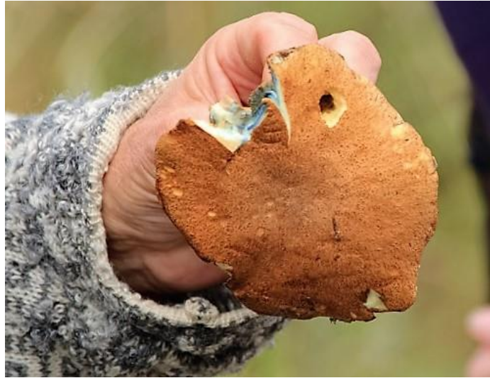
Sandsopp med blånande snitt.

Motaggsvampen är en rödlistad art enligt Sveriges rödlista 2015 i kategorin NT, nära hotad. Den lever i symbios med tall och påträffas ofta i gammal tallnurskog, ofta i hållmarksområden. Motaggsvampen har minskat i antal sedan 1960-talet och fortsätter att minska i takt med att urskog med tall försvinner. Där motaggsvampen växer ensam eller bara i några få exemplar bör den inte plockas.