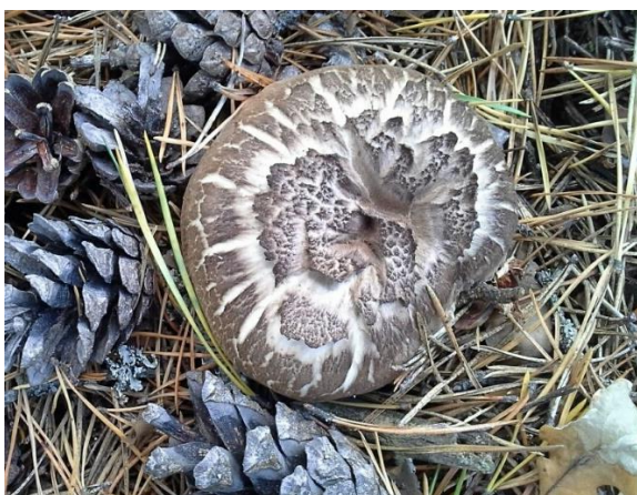
Motaggsvampen är rödlistad NT, nära hotad.

Vi såg också en annan rödlistad art som växer i skogar och hagar med ek, gyllensopp, en relativt liten sopp med upp till 5 cm bred hatt och lysande guldgula rör. Gyllensopp är i Sverige rödlistad som sårbar, VU.